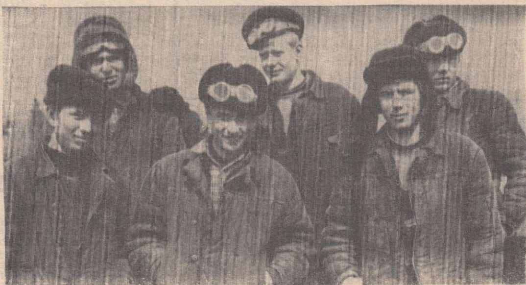
На этом снимке практиканты Шеломковского училища механизации, работающие сеяльщиками на второй ферме совхоза имени Дзержинского.

Все они комсомольцы и работают как и подобает этому званию.